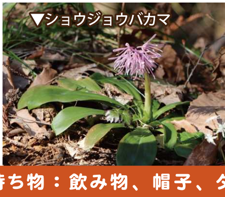
▼ショウジョウバカマ